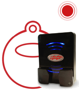
TAG MIFARE LEGIC