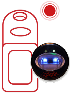
MY KEY IR KEY